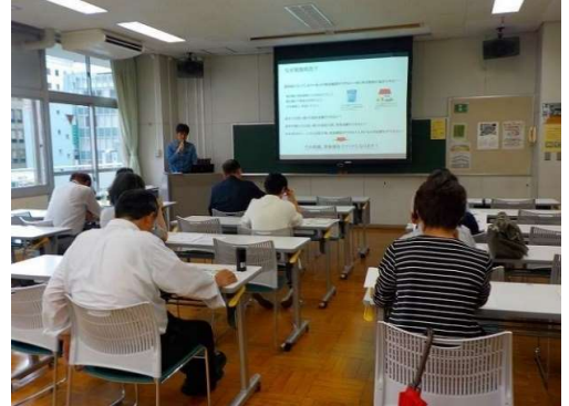
お気軽にご参加下さい