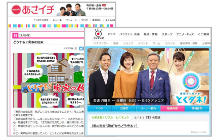
引用：NHKあさイチ、フジテレビとクダ

財産管理手法の1つとして、資産保有者（ 委託者 ）が「 契約 」によって、信頼できる相手（ 受託者 ）に対し、資産（不動産・預貯金・株式等）を移転し、一定の目的（ 信託目的 ）に従って、特定の人（ 受益者 ）のためにその資産（ 信託財産 ）を管理・処分・運用することをいいます。