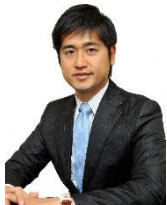
株式会社 つなぐ相続アドバイザーズ