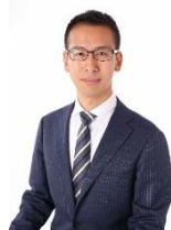
株式会社 つなぐ相続アドバイザーズ