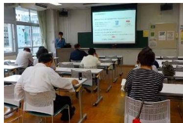
過去の勉強会の風景 港区生涯学習講座「まなび屋」講師、某金融機関の社内研修等過去30回以上開催