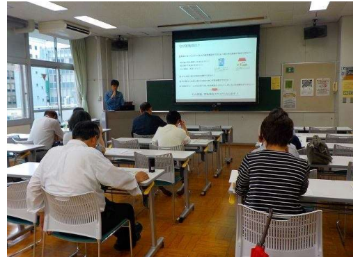
過去の勉強会風景

家族信託、相続対策についての基本的なことについて 講義させていただきます。お気軽にご参加ください。