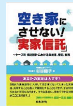
杉谷範子 著 『空き家にさせない! 実家信託』