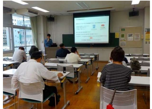
過去の勉強会風景

家族信託、相続対策についての基本的なことについて 講義させていただきます。お気軽にご参加ください。